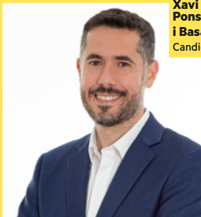
Xavi Ponsdomènech i Basart Candidat a l'alcaldia